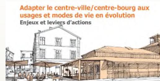
Dessin d'illustration non contractuel